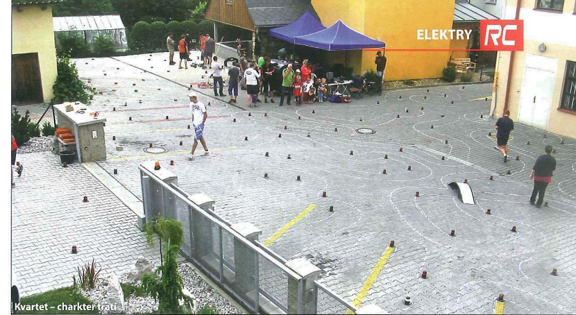
Kvartet – charkter vau