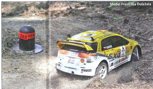
Model Františka Doležala