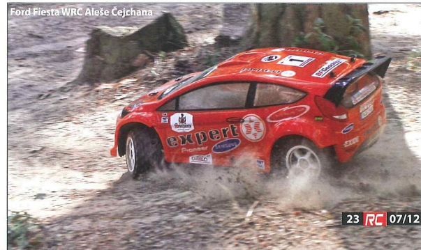
Ford Fiesta WRC Aleš Čejchana