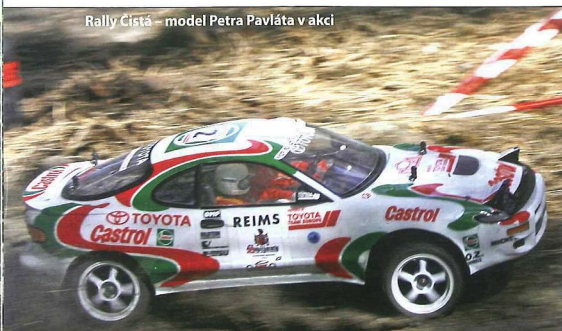
Rally Čistá – model Petra Pavláta v akci